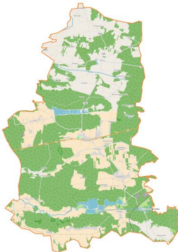
RYSUNEK 1. GRANICE ADMINISTRACYJNE GMINY KLUKI.